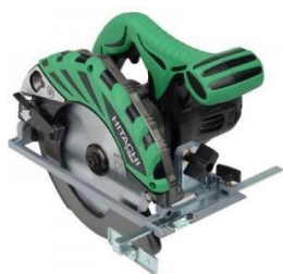
Электропила по дереву